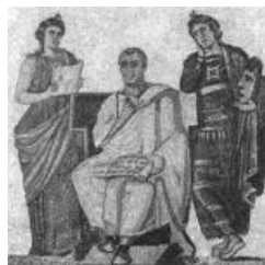
Titus Livius ja muusik Kleio ja Melpomene.

Roomalaisen historiankirjoituksen alkulähteillä