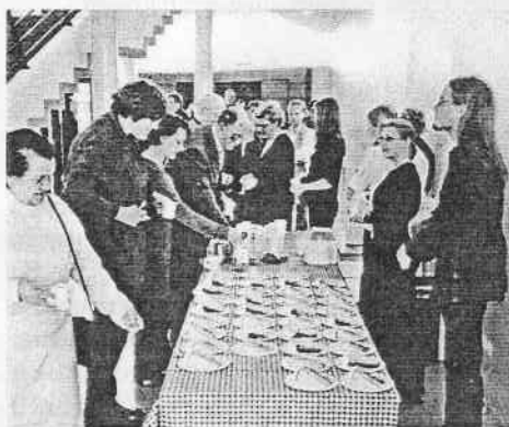
Paideian jäseniä syntymäpäiväkakun äärellä