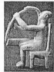
Lyyran soittajaa kuvaava marmorinen pienoispatsas Kykladeilta. 3. vuosituhat eKr. Metropolitan Museum of Art, New York.

siitä, miten Homerosta antiikissa mahdollisesti laulettiin.