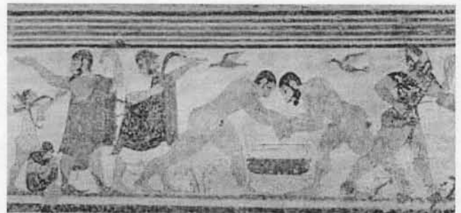
Tomba degli Auguri, Tarquinia

maanantaina 20.11. 2000 klo 18, Turun yliopiston Tauno Nurmela –salissa (ls 1, päärakennus)